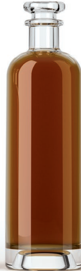
70 cl BOLD 75 cl BOLD